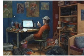
Eerst het belangrijkste

Bij D66 zijn er vrijwilligers die zich voor langere tijd inzetten voor de vereniging, bijvoorbeeld door bestuurslid te zijn van de afdeling. Maar er zijn ook vrijwilligers die betrokken zijn bij een bepaald project zoals een campagne. Het afdelingsbestuur wil een goede balans tussen beide vormen vinden. Met dit activiteitenoverzicht kun je zien op welke manieren je je kunt inzetten voor D66 Leiderdorp-Zoeterwoude. Hopelijk zit er een goede optie voor je tussen!